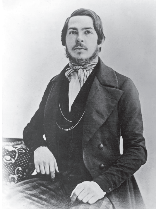
شكل ٤-١: فريدريك إنجلز، عام ١٨٤٥.

كادت مخطوطة كتاب «الأيدولوجية الألمانية» تكون مكتوبة بالكامل بخط يد إنجلز، وكانت التصحيحات والتغييرات بخط كلا المؤلفين. في بعض الأحيان، كانت الصفحات مقسمة إلى عمودين، كان النص على اليسار، والإضافات على اليمين، وكان خط ماركس يكاد لا يُقرأ، وقيل إن إنجلز قد كُفَّ بعملية كتابة النص الذي اشتركا شفهيًا في تأليفه. كان العمل من الناحية الفلسفية مماثلًا للأعمال السابقة لماركس أكثر مما كان مماثلًا لأعمال إنجلز، وكان القسم الأول مستقى مباشرةً من مقالة ماركس «أطروحات حول فيورباخ»، التي كتبها في أوائل عام ١٨٤٥ قبل وصول إنجلز إلى بروكسل. وفي هذه السطور القليلة، شنَّ ماركس هجومًا على «كافة أشكال المادية السابقة» (الأعمال المجمعة