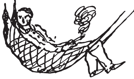
شكل ٢-٣: رسم كاريكاتيري رسمه إنجلز لنفسه، في أغسطس ١٨٤٠: «أرجوحتي الشبكية تضمنني وأنا أدخن السيجار».

الملك فريدريك فيليام الرابع ملك بروسيا كان هذا الأمر كفيلاً بجعله ثورياً. وكتب إنجلز فقال: «يتزايد تركيز الرأي العام في بروسيا أكثر وأكثر على مسألتين؛ ألا وهما: الحكومة التمثيلية، وحرية الصحافة على وجه الخصوص»، وهذه مطالب ليبرالية تقليدية (الأعمال المجمعَة لماركس وإنجلز، المجلد الثاني). وفيما يتعلّق بالمسألة الثانية، فقد اقتبس إنجلز في إحدى مقالاته المادة رقم ١٥١ من قانون العقوبات في بروسيا، التي تمنع «النقد الفجّ وغير المحترم والسخرية من قوانين الأراضي والمراسيم الحكومية»، وأعلن قائلاً: «أنا صادق على نحو كافٍ بحيث أقول إنني عاقد النية على إثارة السخط والاستياء ضد المادة رقم ١٥١ من قانون العقوبات في بروسيا». واقترح «الاستمرار في استخدام الأسلوب الحسن النية والمهذب الموضّح هنا لإثارة أكثر من مجرد بعض السخط والاستياء ضد كل الأمور الرجعية وغير الليبرالية الموجودة في مؤسسات دولتنا» (الأعمال المجمعَة لماركس وإنجلز، المجلد الثاني). وفيما يتعلّق بالمسألة الأولى — الحكومة التمثيلية — علّق إنجلز (مستخدماً علامة الحذف على نحو مؤثّر) فقال: «الوضع الحالي في بروسيا قريب الشبه بالوضع في فرنسا قبل ... لكنني أنأى بنفسني عن أي استنتاجات سابقة لأوانها» (الأعمال المجمعَة لماركس وإنجلز، المجلد الثاني).