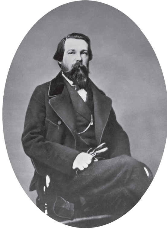
شكل ٧-١: فريدريك إنجلز في منتصف حياته.

من الوعي الاجتماعي، ونمط الإنتاج الخاص بالحياة المادية يُكَيِّف العمليات الحياتية الاجتماعية والسياسية والفكرية في العموم. ليس وعي الناس هو ما يحدّد وجودهم، بل على العكس، وجودهم الاجتماعي هو ما يحدّد وعيهم (الأعمال المختارة لماركس وإنجلز، المجلد الأول).