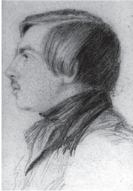
شكل ٢-٢: فريدريك إنجلز في سن التاسعة عشرة.

كانت تأملات جورج فيلهلم فريدريش هيغل عن الوعي والوجود والتاريخ والدولة والدين والطبيعة وغيرها من الموضوعات العديدة التي لا يمكن حصرها؛ تجريديةً إلى حدٍّ كبير. علاوةً على ذلك، فقد كانت بعض كتاباته غامضة؛ فالاستنتاجات التي توصل إليها ربما لم تكن هي الاستنتاجات الوحيدة التي يمكن استنتاجها من تحليلاته الفلسفية — أو ربما لم تكن الاستنتاجات الأوفر حظاً في إمكانية دعمها. وتعارضت فلسفته عن الدين، المتوافقة مع التأويلات الخاصة بمذهب الواحدية، مع تعليقاته المؤيدة للوثنية واعتناقه المعلن لها. وبالمثل، فإن دفاعه عن دولة بروسيا لم يكن نتيجةً واضحةً لتفكيره المنطقي