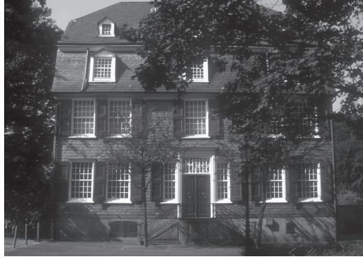
شكل ١-٢: متحف منزل عائلة إنجلز في بارمن (فوربتال حالياً)، ألمانيا، حيث وُلد فريدريك إنجلز عام ١٨٢٠.

والتي توجد تقريباً في كل مكان في ألمانيا»، وكان سبب ذلك هو المصانع (الأعمال المجمعّة لماركس وإنجلز، المجلد الثاني).